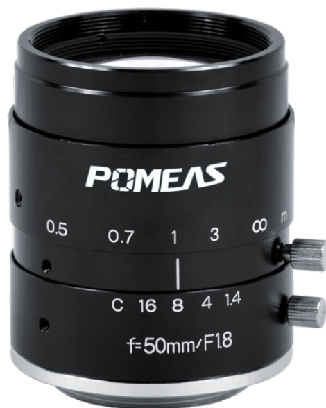
VP-LE-5018M百万像素工业镜头参数表